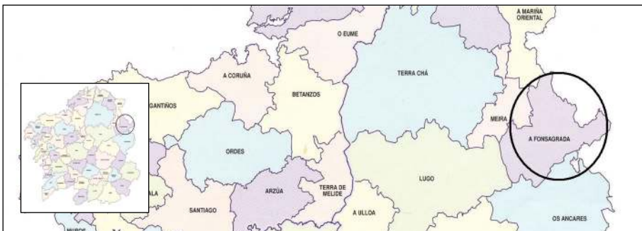
Fig. 5. Jota en la Fonsagrada

En el noreste de Galicia, nos encontramos con una zona de grandes gaiteros, donde los bailadores/as van a la par. Siempre acompañados con castañuelas, a diferencia del resto de zonas, no existe un único guía, sino que los bailadores se van turnando o mejor dicho pisando unos a otros para marcar el punto. Son puntos muy marcados y saltados con desplazamientos no demasiado grandes. Como en otras zonas el punto va precedido del paseo, que suelen ser variaciones del paso castellano. El corte del punto además de cambiar de paso, el guía en ese momento lo marca con tres toques consecutivos de las castañuelas, por lo general no abren rueda, si no que hacen la vuelta en diagonal, con eje central. Cabe destacar que es la única zona de Galicia, en la que los bailadores/as no hacen caso de las partes de la música, puesto que los gaiteros nunca tocan la misma pieza igual; siempre le dan una vuelta diferente, improvisando en cada vuelta; esto es lo que provoca que los bailadores/as, no hagan caso de las partes de la música y al igual que hacen los gaiteros con la melodía, vayan improvisando el baile.