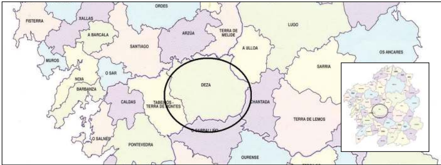
Fig. 4. Jota en el norte de Ourense y Pontevedra

Como se aprecia en el mapa, esta comarca está en el centro de nuestra comunidad.