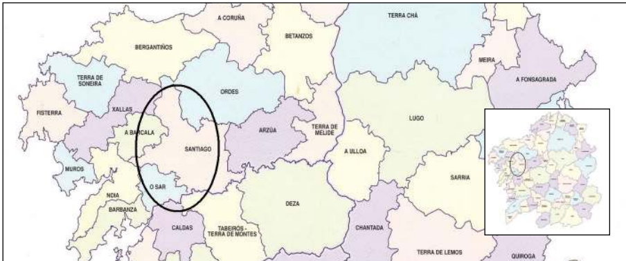
Fig. 2. Pateado

mos asegurar que fuese un baile con un único guía; tampoco nos queda claro si era un baile de un solo grupo de bailadores/as o de varios grupos. Como podemos ver señalado en el mapa, la zona donde se bailaba el pateado comprendía Santiago de Compostela y algunas comarcas limítrofes, como A Mahía o Padrón. Según llega hasta nosotros, el acompañamiento musical que recibía el pateado estaba compuesto por gaita, tambor y bombo, para después pasar a ser acompañado por la misma percusión pero por dos gaitas.