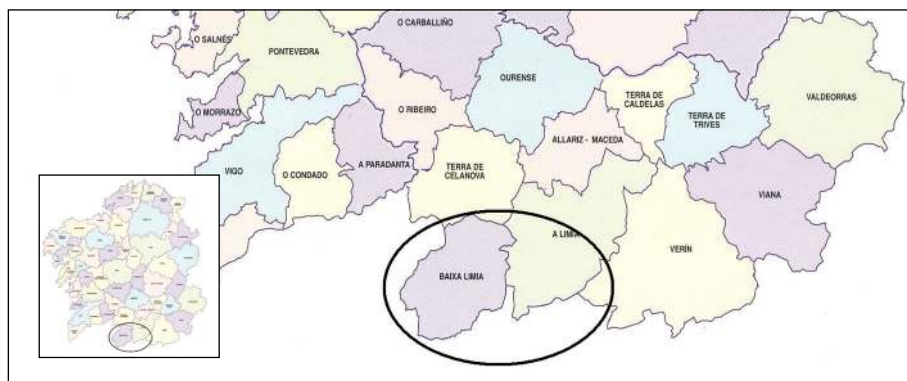
Fig. 1. O Vira