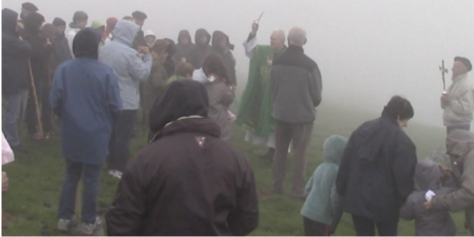
Figura 5. Bendición del aire (Fotograma de vídeo. Fondos del Archivo del Patrimonio Inmaterial de Navarra).

Xalbatore. En Azkarate, por último, la llegada de la pareja de mi informante nos hizo recalar en el tema de los cantos. En el transcurso de esta parte de la entrevista, abordamos los recuerdos sobre las canciones infantiles que se cantaban en pequeños juegos con los niños. La informante recordó la canción Arri arri mandoko , en la que se muestra el fuerte lazo de unión con Navarra, puesto que se refiere a Iruña (Pamplona) como la ciudad más cercana.