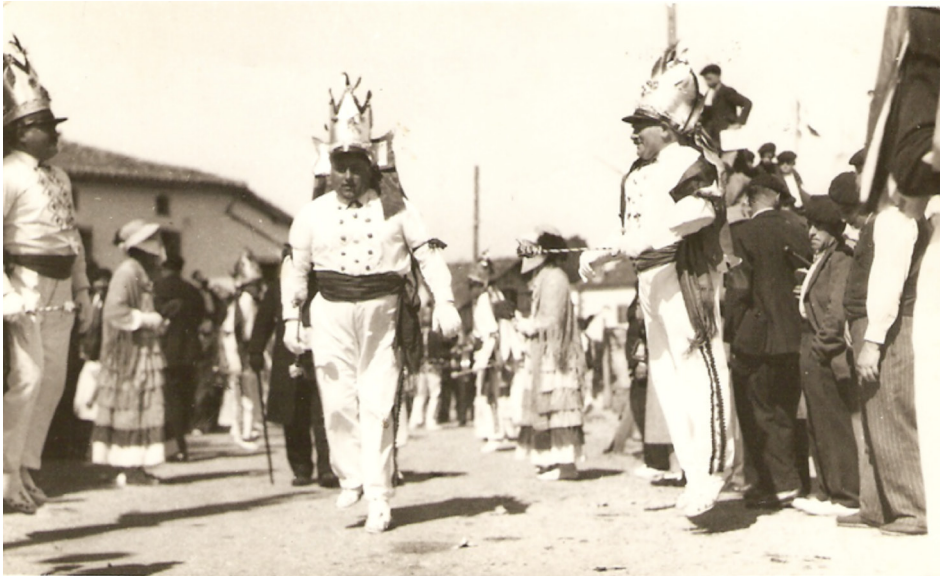
Figura 2. Tobera en Baja Navarra (Fondos del Archivo del Patrimonio Inmaterial de Navarra).

un caso (Zumthor, 1989) o secundaria en otros (Ong, 2001). La oralidad mixta, aquella en que la escritura es posterior al intercambio vocal y que trata de registrarlo, la podemos percibir en el caso de los bertso paperak u hojas impresas que recogían los bertsos y composiciones de bertsolaris y troveros o poetas populares. Fueron un género muy difundido en el contexto de mercados, ferias y fiestas, donde se vendían. Por otro lado, el teatro popular ha tenido gran importancia en Baja Navarra. Estas complejas representaciones tradicionales fueron las toberak y, en menor medida, las pastoralak , de influjo suletino. Son ejemplos de oralidad secundaria, donde el texto escrito por autores conocidos incorpora música, canto y danzas.