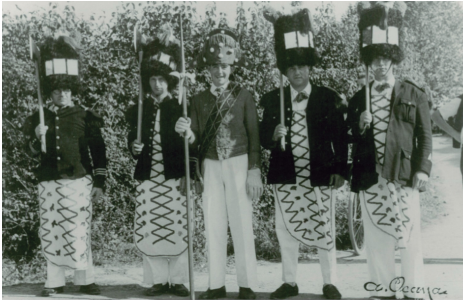
Figura 4. Besta berri en Baja Navarra (Fondos del Archivo del Patrimonio Inmaterial de Navarra).

a las generaciones siguientes. Toda esta metodología me ha permitido realizar y grabar una serie de entrevistas muy representativas en la zona sur y norte de Baja Navarra, dos zonas de límites o fronteras interesantes: al sur, al lado de la frontera con Navarra, en Garazi; y al norte, en Agaramonte, en una zona de transición e hibridación de las culturas vasca y gascona. El trabajo ha concluido con la edición y transcripción de estas entrevistas que se podrán ver en el APIN-NOMA.